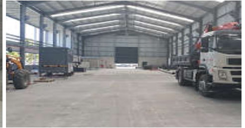
Pavimentos Industriais : unidade Fabril 12,6 mt vão ; 20 Kn/m 2 ; 2011