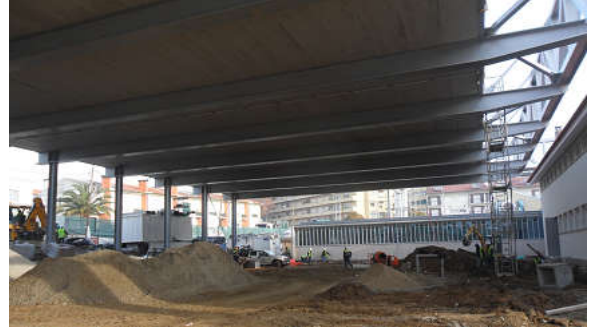
Lages 100% maciças.. "24h" ; (Norasil..Lda..2011)