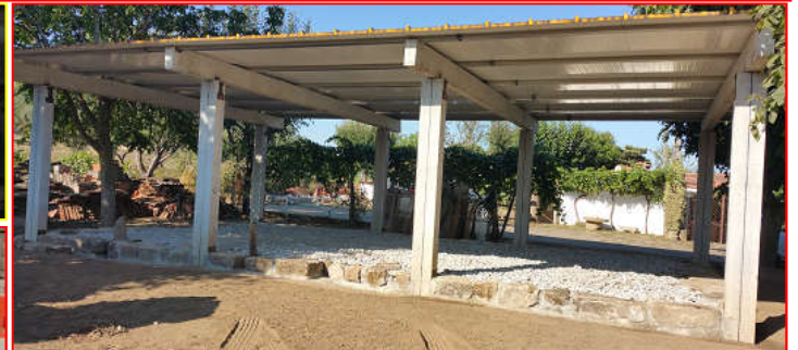
Painéis Encerramento ( Valpaços)